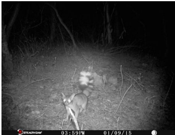
Cacomixtle ( Bassariscus astutus )