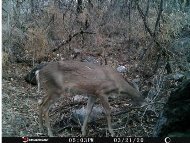
Venado cola blanca ( Odocoileus virginianus )

entre ellos venados, coatíes, cacomixtles, coyotes, zorras grises, zopilotes, tapacaminos y perros domésticos.