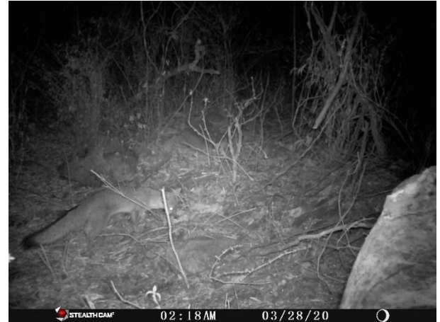
Zorra gris ( Urocyon cinereoargenteus )